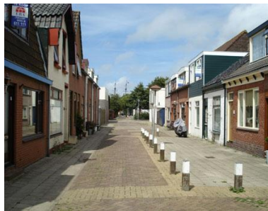
En in 2007, waarschijnlijk van de andere kant, richting N.O.

Gedurende de eerste twee decennia van de 20 e eeuw