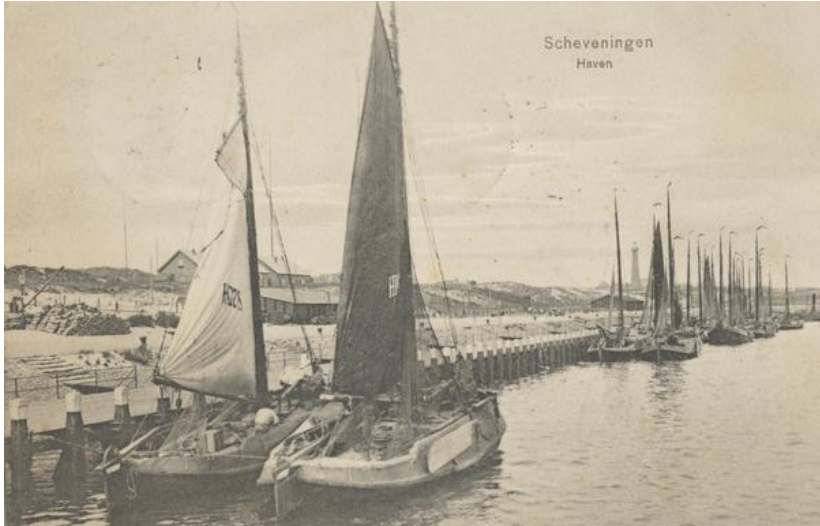
Twee botters met HD registratie in Scheveningse haven.